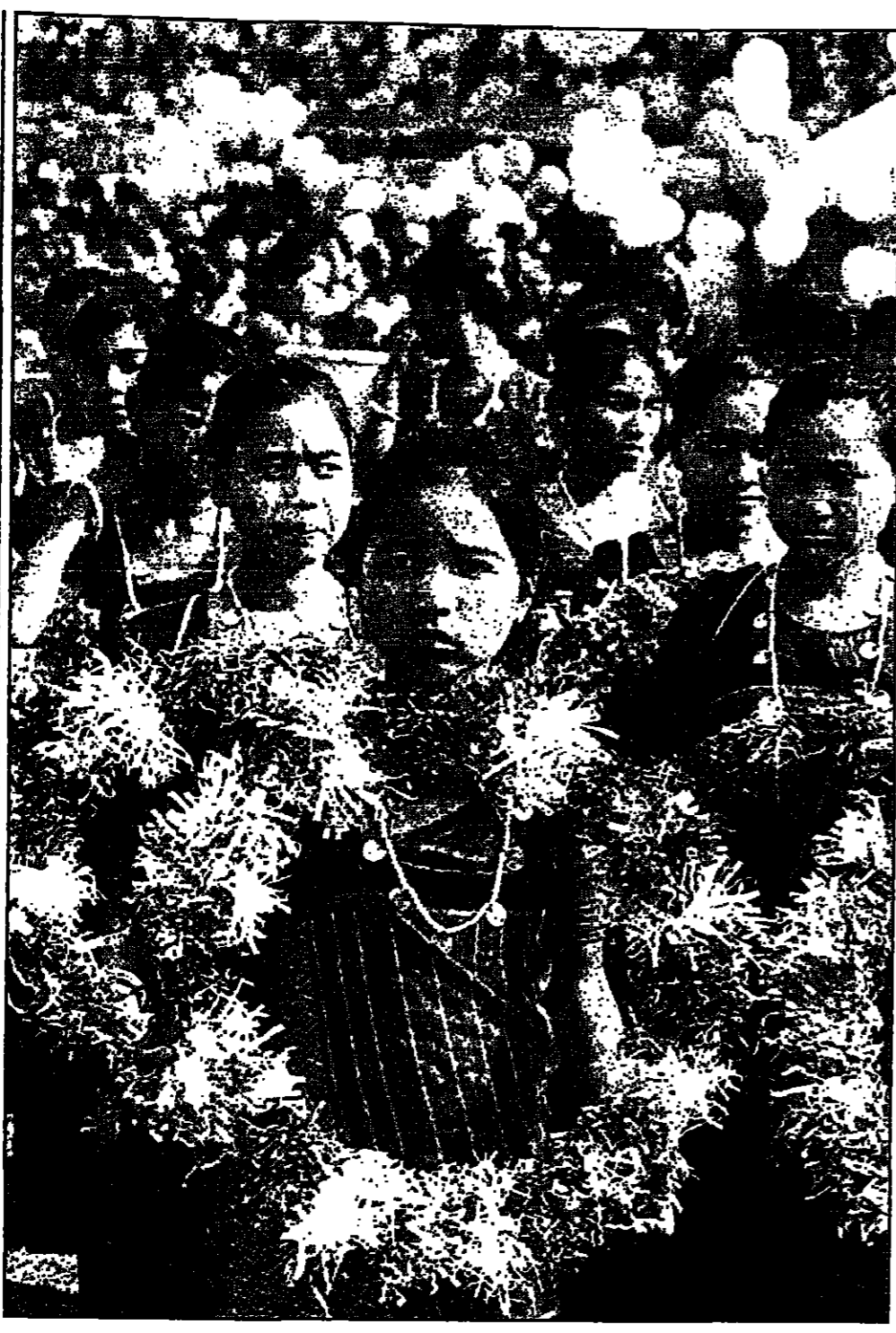
فتيات بنغلاديش يرتدين ازياء تقليدية ملونة في رقعة شعبية احتفالا بعيد استقلال بلادهم

طهران - ق ن: اذاعته وكالة الانباء الايرانية ان قوات الامن الايرانية ضبطت مؤخرا أكثر من طن ونصف الطن من المخدرات في شرق وجنوب شرق البلاد، واعلنت الوكالة عن اعتقال 16 مهربا وضبط 1.1 طن من مختلف انواع المخدرات في محافظة خراسان (شرق)، اثر عمليات وتفتيشات ميدانية، بما فيها مدينة مشهد الكبيرة ومدينة سراسخون الواقعة على الحدود مع تركمانستان.